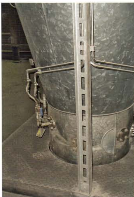
Über-Kreuz-Montage der Staudrucksonden.

heiten an. Jetzt ist nur mehr eine schnell vorzunehmende Dichtigkeitskontrolle erforderlich. Um diese erhebliche Beeinträchtigung des Betriebs samt dem durch Fehlmessung bei zu geringer Luft verursachten Mühlenrumpeln zu vermeiden, entschlossen sich die für die