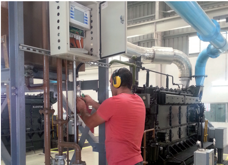
Bild 3 Das fertig montierte deltaxwaveC.