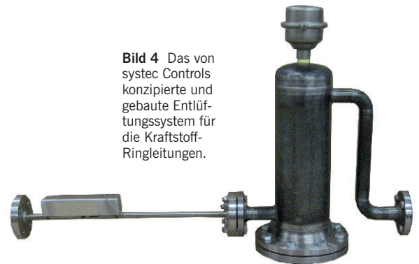
Bild 4 Das von systec Controls konzipierte und gebaute Entlüftungssystem für die Kraftstoff-Ringleitungen.

Das spezielle von systec Controls weiterentwickelte Kreuzkorrelationsverfahren weist hier eine deutlich höhere Messstabilität und -genauigkeit auf.