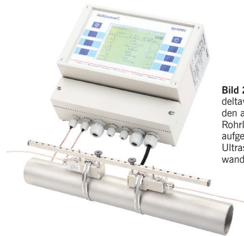
Bild 2 Das deltaxwaveC mit den auf die Rohrleitung aufgespannten Ultraschallwandlern.