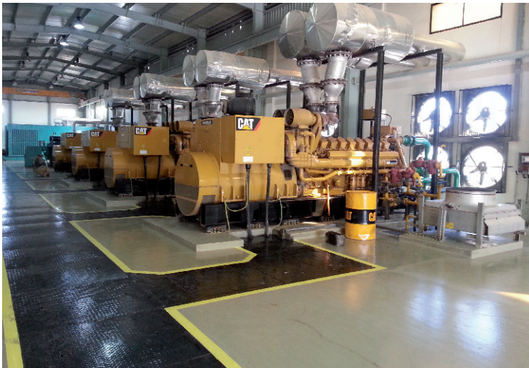
Bild 1 Die Dieselmotoren im Kraftwerk.