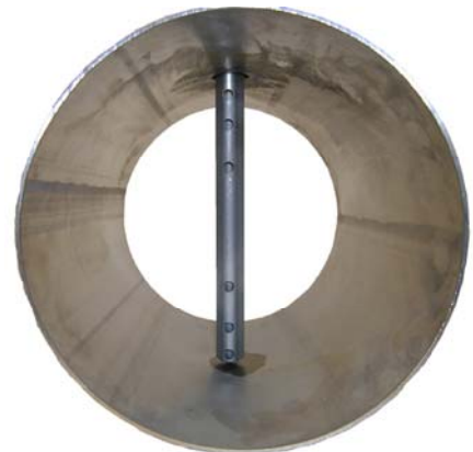
das Profil der deltaflow kann durch die Vielpunktmessung auch gestörte Strömungsprofile exakt erfassen

Für Sie bedeutet das, dass Sie ein langzeitgenaues und absolut robustes Messverfahren einsetzen, das Ihren Wartungsaufwand minimal hält und Ihnen die Qualität Ihrer Regelung auch noch nach Jahren sicherstellt.