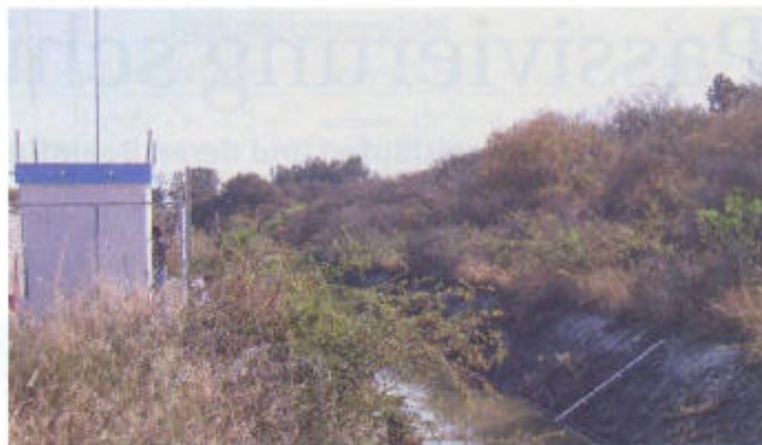
Die solarbetriebene „Messwarte“ für die Ultraschall-Durchflusstechnik