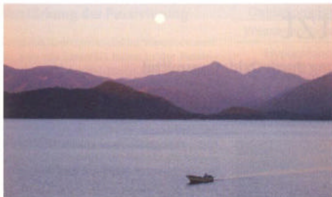
Der Stausee Cajón de Peña in der Region Jalisco ist mit einem Speichervolumen von 23 955 m 3 und einer Oberfläche von ca. 33 300 ha einer der größten Stauseen Mexikos