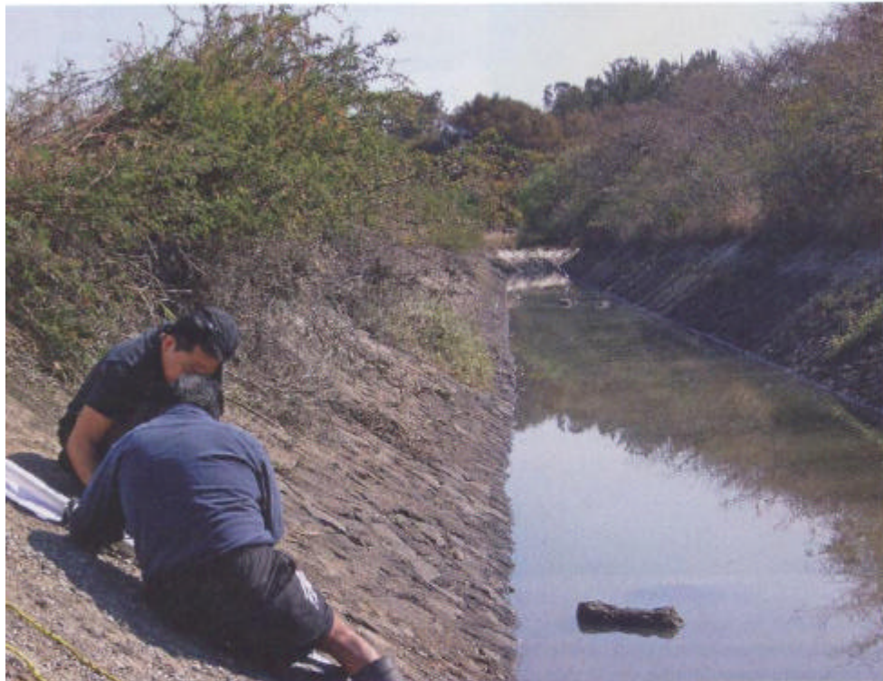
Die Installation der Sensoren an den Kanalwänden

knapp ist. Enorm wichtig wird die effiziente Steuerung eines Kanalnetzes. Wichtigste Regelparameter dazu sind die jeweiligen Durchflüsse, die deshalb mit höchster Genauigkeit zu messen sind. Um die geforderte Messsicherheit und Genauigkeit der Messung im offenen Gerinne zu erreichen, setzt die nationale mexikanische Wasserbehörde Ultraschall-Durchflussmesstechnik ein.